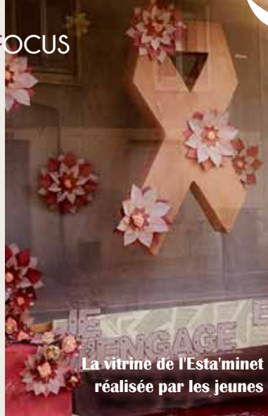
La vitrine de l'Estaminet réalisée par les jeunes

Même les jeunes du FJEPSCS ont participé (ruban et vitrine de l'Estaminet rue du Temple).