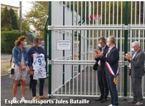
Espace multisports Jules Bataille

Les familles, présentes, ont été très touchées par ce geste initié par la commune.