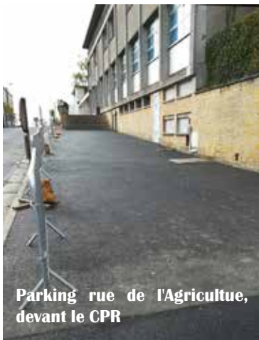
Parking rue de l'Agriculture, devant le CPR