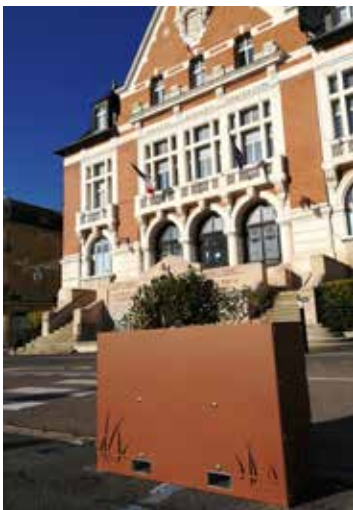
De superbes bacs à fleurs ornent le haut de la place Carnot (fabrication Agil de Vouziers)