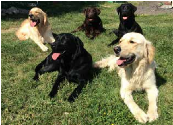
Orko accompagné de ses "copains de promo", Ollblack, Ouméa, Odor et Ovalie

Pour en savoir plus, consulter le site www.handichiens.org