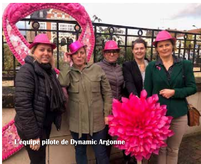
L'équipe pilote de Dynamic Argonne