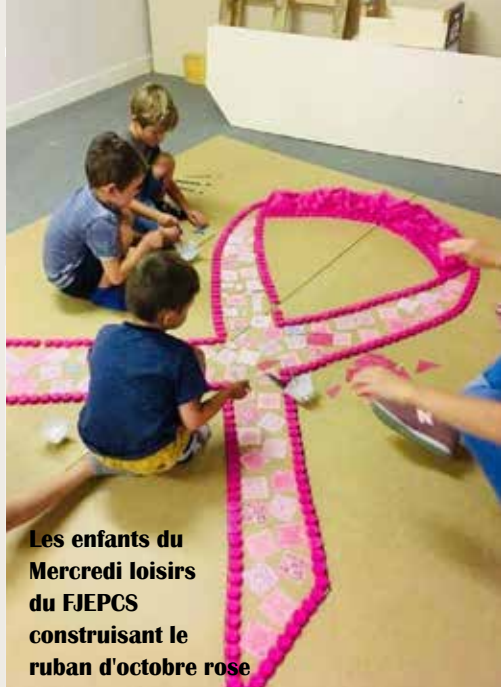
Les enfants du Mercredi loisirs du FJEPSC construisant le ruban d'octobre rose

Plus d'une trentaine de commerçants de Dynamic Argonne ont paré leurs vitrines, toutes plus jolies les unes que les autres, de sujets roses.