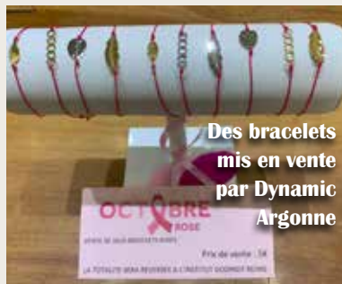
Des bracelets mis en vente par Dynamic Argonne

Le couvre-feu et les restrictions physiques n'ont pas permis au match de rugby prévu de clore ce riche programme.