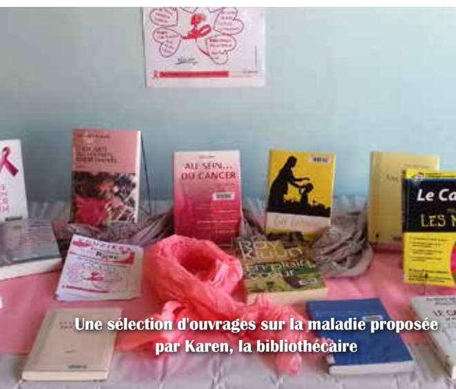
Une sélection d'ouvrages sur la maladie proposée par Karen, la bibliothécaire