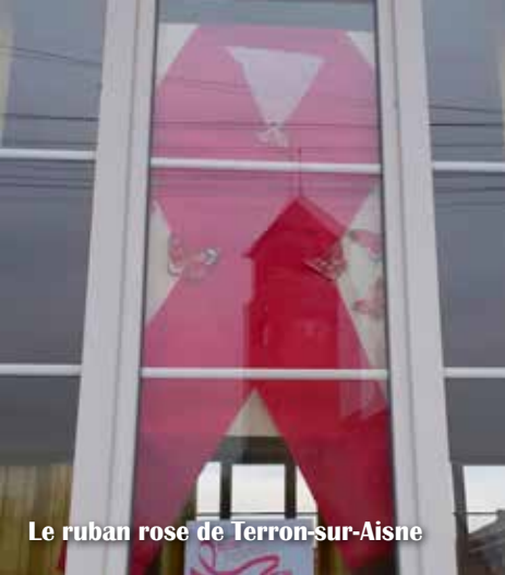
Le ruban rose de Terron-sur-Aisne