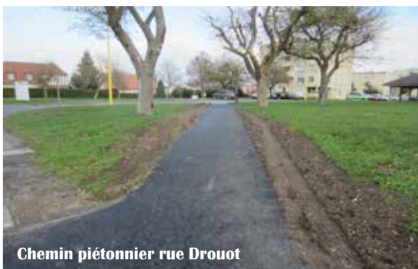
Chemin piétonnier rue Drouot

Travaux réalisés par l'entreprise Poncin sous maîtrise d'œuvre du bureau d'étude VRD Conseil de Vouziers