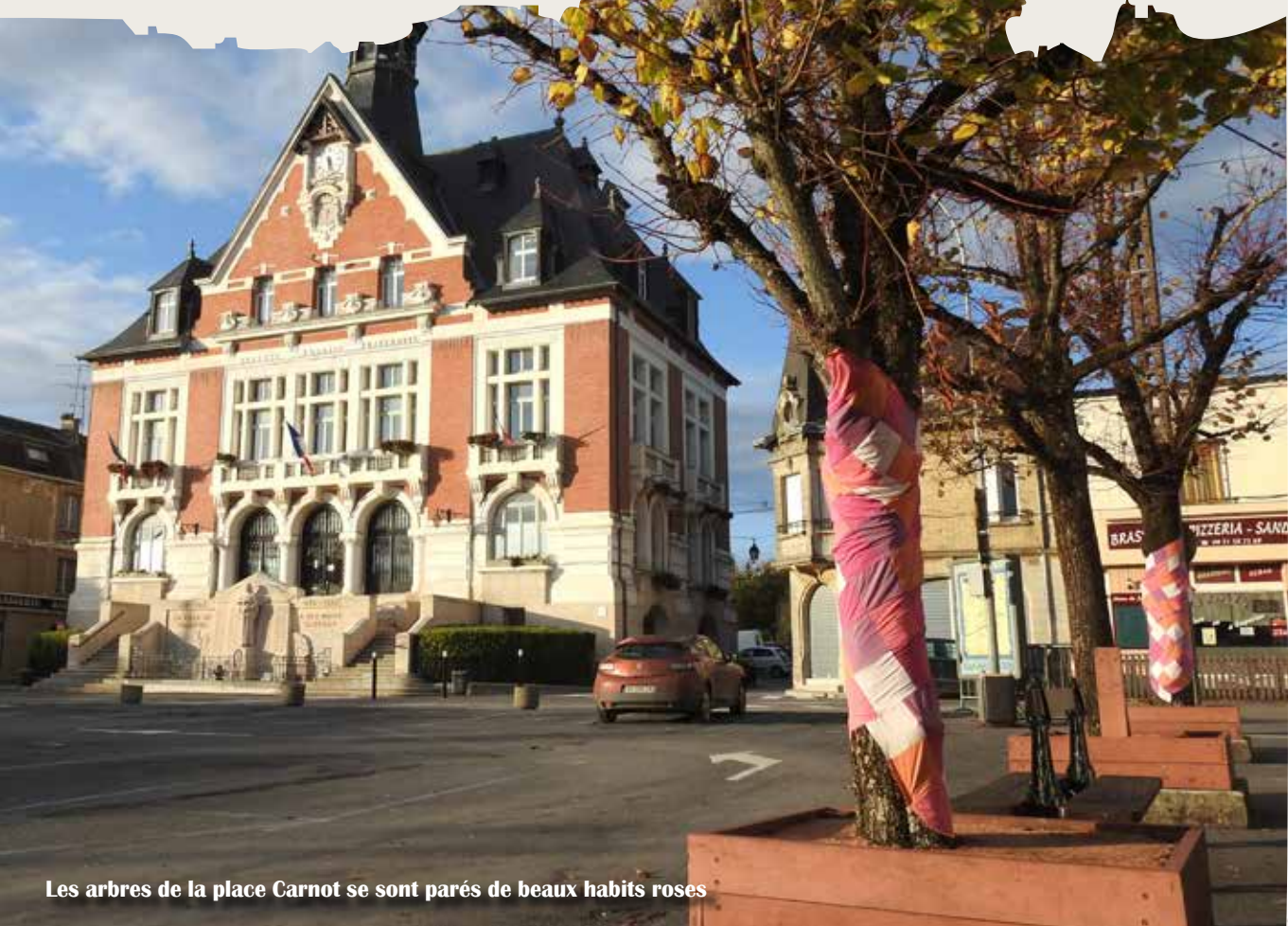
Les arbres de la place Carnot se sont parés de beaux habits roses

Cette somme sera reversée à l'institut Godinot de Reims. Bravo à tous.