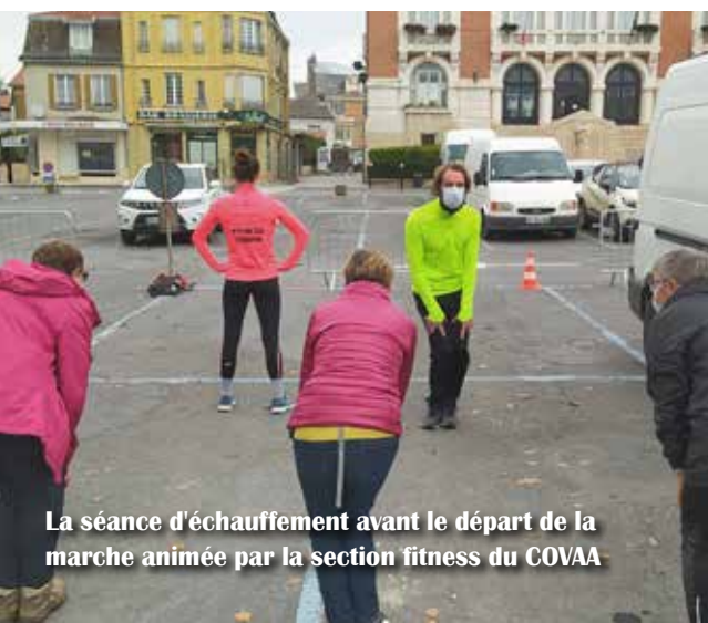
La séance d'échauffement avant le départ de la marche animée par la section fitness du COVAA