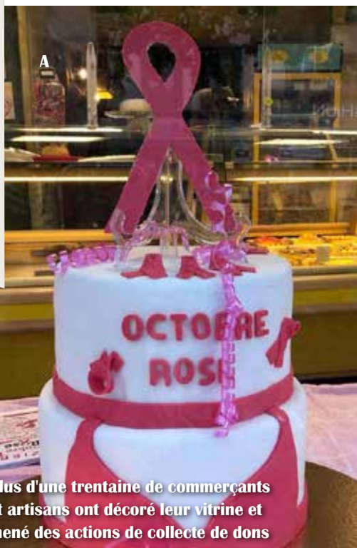
Plus d'une trentaine de commerçants et artisans ont décoré leur vitrine et mené des actions de collecte de dons