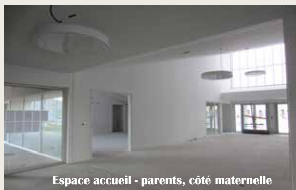
Espace accueil - parents, côté maternelle