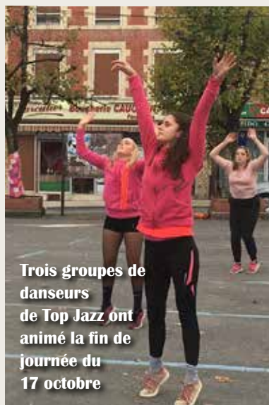
Trois groupes de danseurs de Top Jazz ont animé la fin de journée du 17 octobre