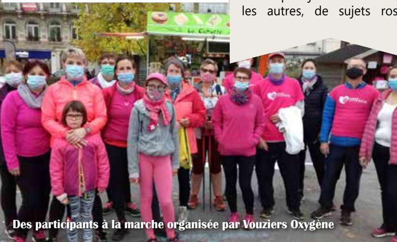
Des participants à la marche organisée par Vouziers Oxygène