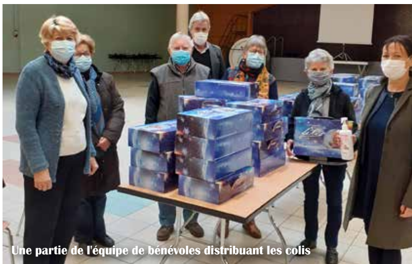
Une partie de l'équipe de bénévoles distribuant les colis

Espérons qu'en 2021, la Ville aura le plaisir de proposer à nouveau le choix entre le repas, si convivial, et le colis de gourmandises.