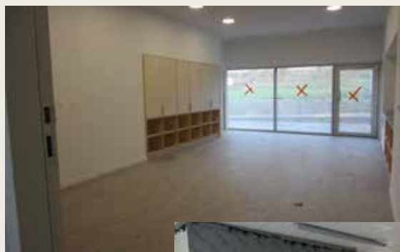
Salle des maîtres

L'aménagement complet du parking y compris la pose des luminaires, la mise en place du mur périphérique et des clôtures, nivellement des espaces verts et engazonnement ont démarré depuis le 19 octobre. Les arbres qui ont dû être abattus pour les besoins du chantier seront remplacés par de nouvelles plantations.