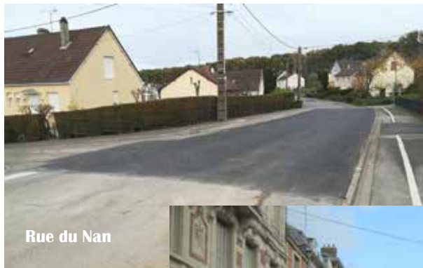
Rue du Nan

Travaux réalisés par l'entreprise Poncin sous maîtrise d'œuvre du bureau d'étude VRD Conseil de Vouziers