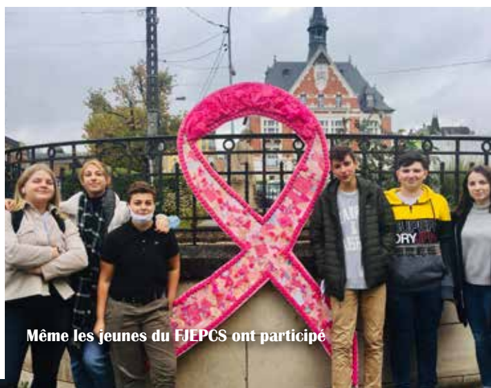
Même les jeunes du FJEPSC ont participé