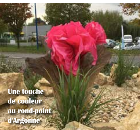
Une touche de couleur au rond-point d'Argonne