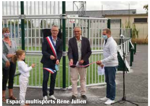
Espace multisports René Julien