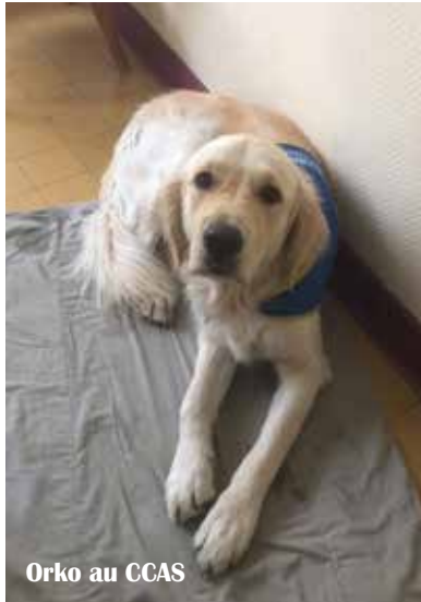
Orko au CCAS