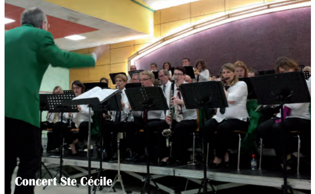
Concert Ste Cécile

Un concert donné par le Cercle Royal Musical d'Aubange en l'église Saint-Maurille a permis aux mélomanes présents d'apprécier un orchestre de haut niveau. L'Harmonie se devait, à son tour, d'offrir aux Vouzinois un concert de qualité. Ce fut le cas une nouvelle fois cette année à l'occasion du concert de Sainte-Cécile. En effet, à l'issue de celui-ci, les com-