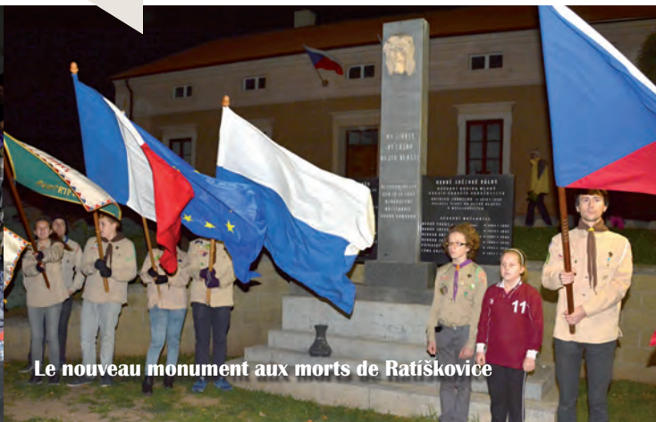
Le nouveau monument aux morts de Ratiskovice