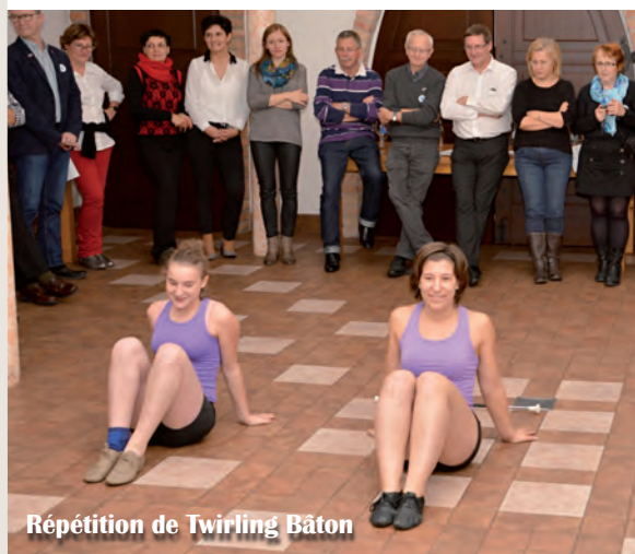
Répétition de Twirling Bâton