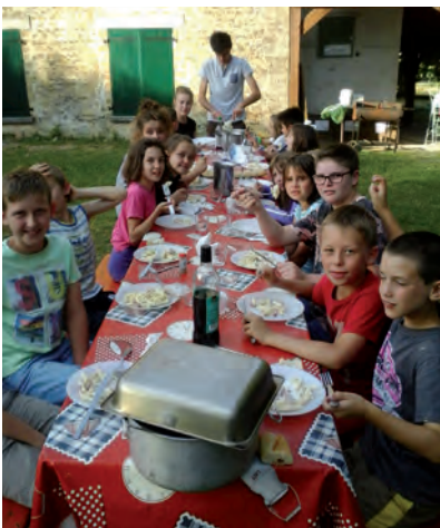
Séjour court à la Maison de la Nature

Inscriptions : Semaine 1 : 84. Semaines 2 et 3 : 90 (complet). Semaine 4 : 88.