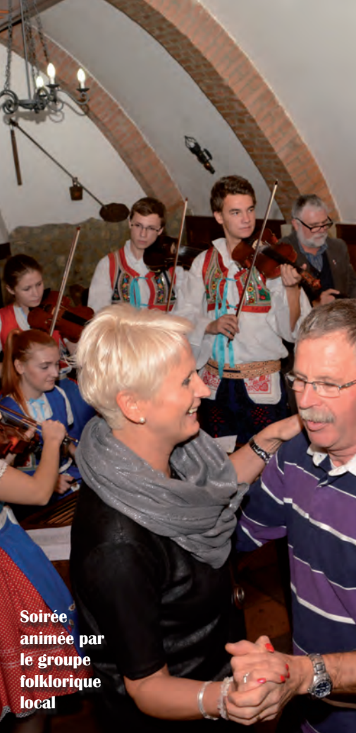
Soirée animée par le groupe folklorique local

Cette année, dans le cadre des échanges Vouziers Ratiskovice, une délégation de 36 personnes s'est déplacée en bus en République Tchèque. La municipalité et le comité d'amitié étaient accompagnés de trois associations : les Embruns d'Ardenne , Top Jazz et le Twirling Bâton ; un porte-drapeau de l'association La Fraternelle faisait également partie de ce déplacement. Le voyage s'est déroulé du 26 au 29 octobre. Durant cette courte période, les visites, cérémonies et spectacles se sont enchaînés. Ce voyage intergénérationnel s'est passé en toute convivialité et dans la bonne humeur. Nous remercions encore vivement nos amis Tchèques pour leur accueil si chaleureux.