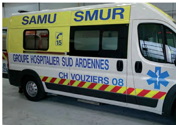
Le nouveau véhicule du SMUR