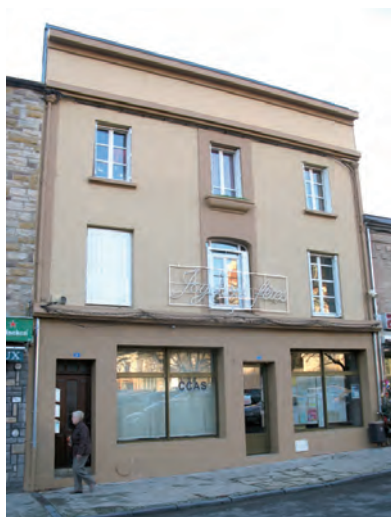
CCAS : nouvelles menuiseries et ravalement de façade

Les travaux d'extension réseaux et voirie, liée à la construction du Centre Aquatique Communautaire