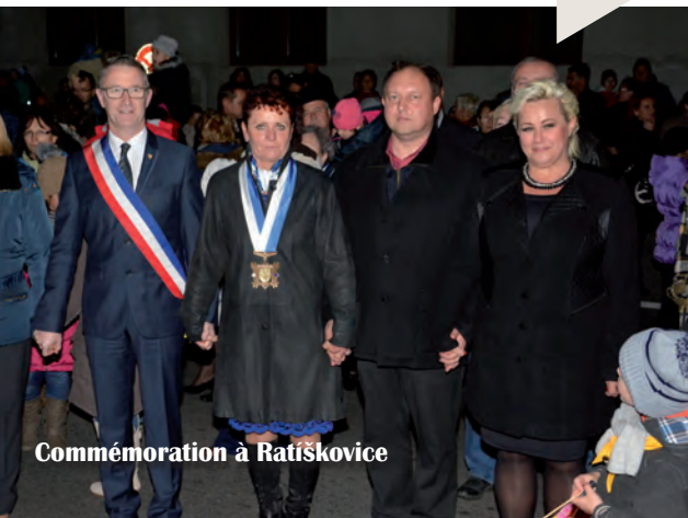
Commémoration à Ratiskovice