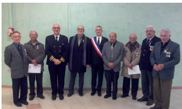
La cérémonie s'est terminée par la remise de 5 médailles aux anciens combattants et porte-drapeau