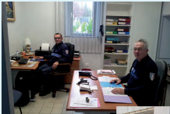
Le bureau de police a été entièrement rénové

Passage en double-vitrage des deux fenêtres du bureau du personnel et rénovation complète du bureau avec changement de la porte d'entrée du bureau de police.