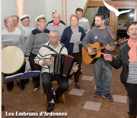
Les Embruns d'Ardenne

Cette année, dans le cadre des échanges Vouziers Ratiskovice, une délégation de 36 personnes s'est déplacée en bus en République Tchèque. La municipalité et le comité d'amitié étaient accompagnés de trois associations : les Embruns d'Ardenne , Top Jazz et le Twirling Bâton ; un porte-drapeau de l'association La Fraternelle faisait également partie de ce déplacement. Le voyage s'est déroulé du 26 au 29 octobre. Durant cette courte période, les visites, cérémonies et spectacles se sont enchaînés. Ce voyage intergénérationnel s'est passé en toute convivialité et dans la bonne humeur. Nous remercions encore vivement nos amis Tchèques pour leur accueil si chaleureux.