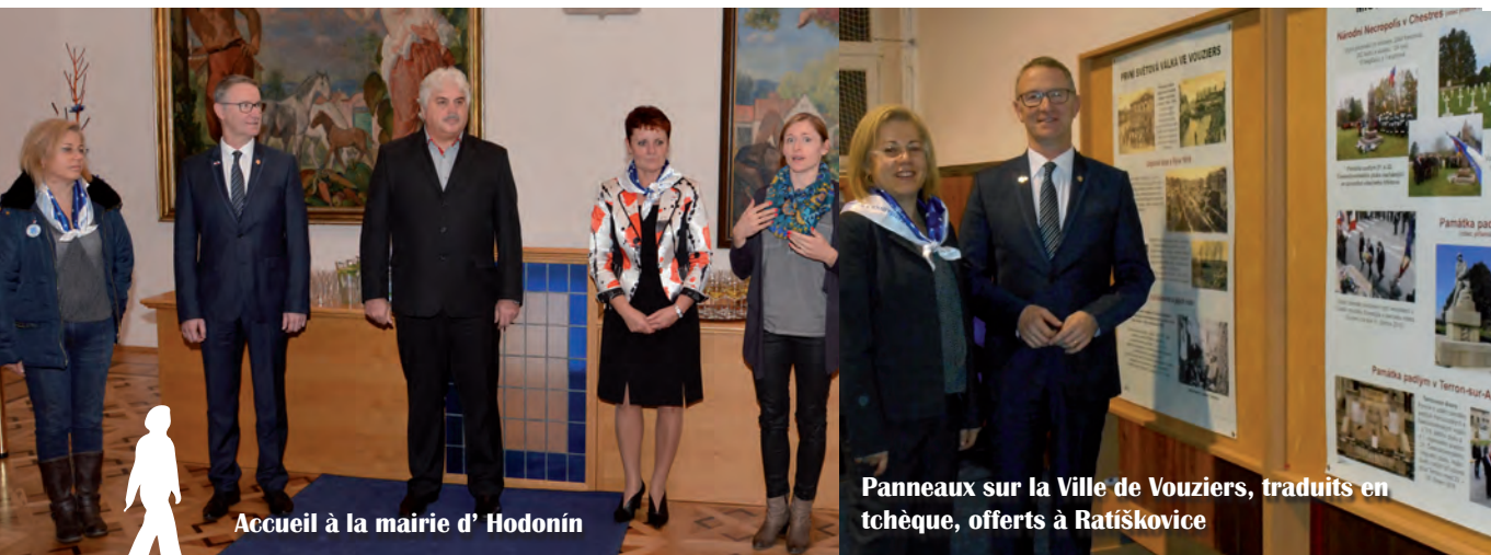
Accueil à la mairie d' Hodonín