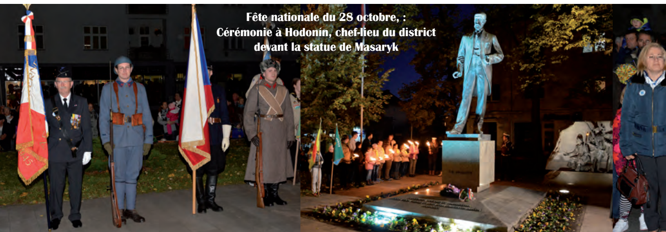
Fête nationale du 28 octobre, : Cérémonie à Hodonín, chef-lieu du district devant la statue de Masaryk