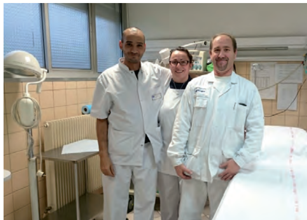
L'équipe du service des urgences

Le service des Urgences de Vouziers est équipé :