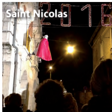
C'est par les airs que saint Nicolas est venu à la rencontre des enfants le 5 décembre. (Organisation : UCIA)