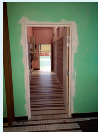
Gymnase Caquot : Le couloir d'accès à la grande salle en cours de réalisation

Ces tableaux permettent d'afficher l'écran d'un ordinateur et le contrôler directement du tableau à l'aide d'un crayon-souris.