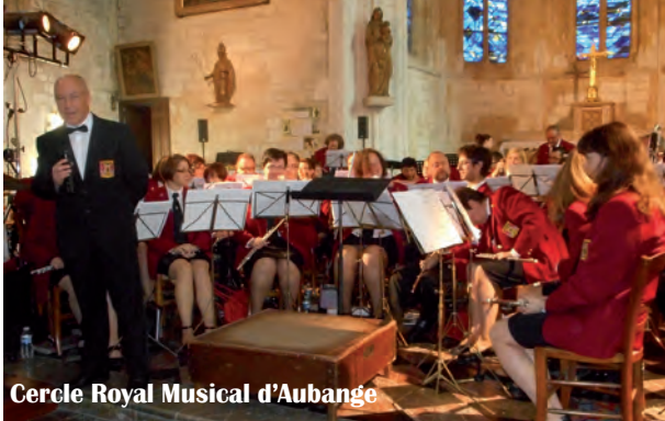
Cercle Royal Musical d'Aubange