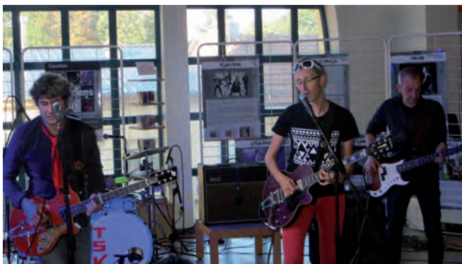
Les Slipping Kangaroos