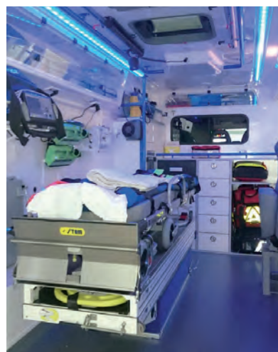
La cellule plus spacieuse est dotée des dernières technologies.

Le patient est pris en charge par une équipe composée d'une infirmière, un ambulancier et un médecin.