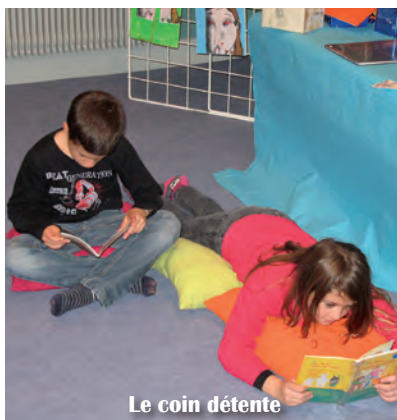
Le coin détente