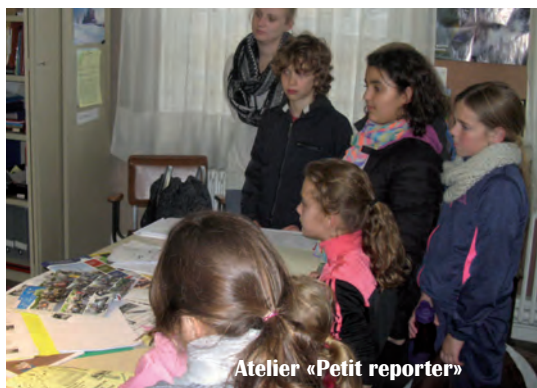
Atelier «Petit reporter»

Période 2 (nov.-déc.): 148 enfants inscrits