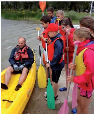
Activité canoë-kayak à Bairon