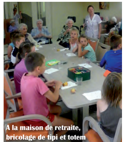
A la maison de retraite, bricolage de tipi et totem