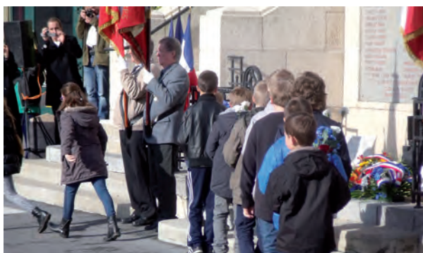
Les enfants des écoles ont lu des textes des poilus et ont déposé une fleur au pied du monument aux morts