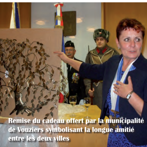
Remise du cadeau offert par la municipalité de Vouziers symbolisant la longue amitié entre les deux villes