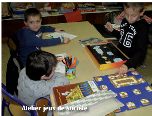
Atelier jeux de société

Les élémentaires bénéficient de la découverte de la philatélie, relaxation, rugby, football et activités manuelles en partenariat avec le FJEP/centre social et diverses associations.