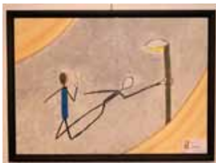
L'ombre de tous les possibles