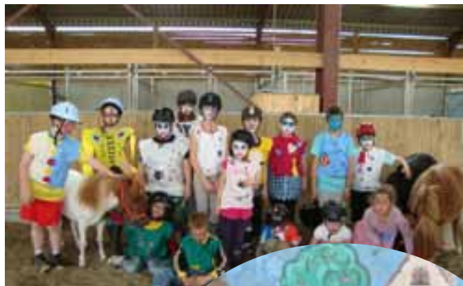
Mini-camp à Roche