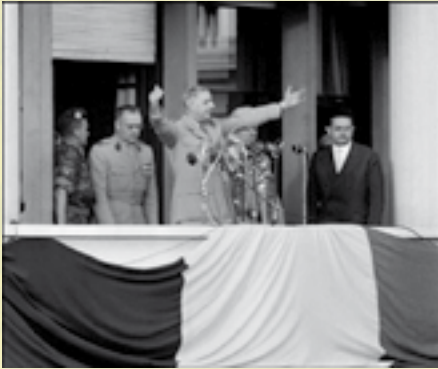
Le célèbre : « Je vous ai compris » prononcé le 4 juin 1958

20 décembre 1960 , les Nations unies entrent en scène en reconnaissant aux Algériens, le droit à l'autodétermination. Trois semaines plus tard, les Français, par référendum, approuvent à 75% ce droit à l'autodétermination du peuple algérien. Naît alors l'Organisation Armée Secrète (OAS) qui rassemble des activistes militant contre l'indépendance de l'Algérie. En