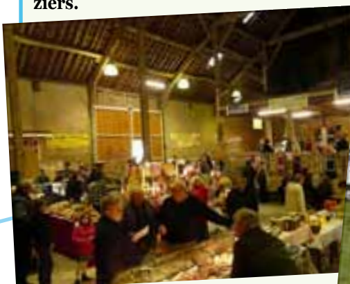
Le marché de Vouziers ressemblera à celui de Tagnon