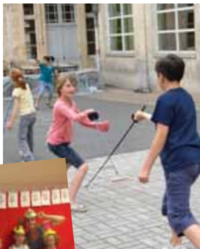
Les 9-10 ans à l'escrime

l'ambiance était au rendez-vous. Félicitations à toute l'équipe et gageons que 2011 sera une "bonne année".