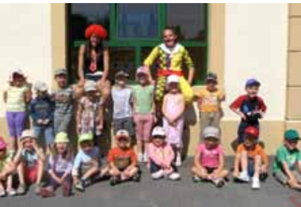
Les 4-6 ans de la première semaine