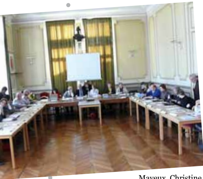
Le conseil municipal en séance dans les salons de l'hôtel de ville