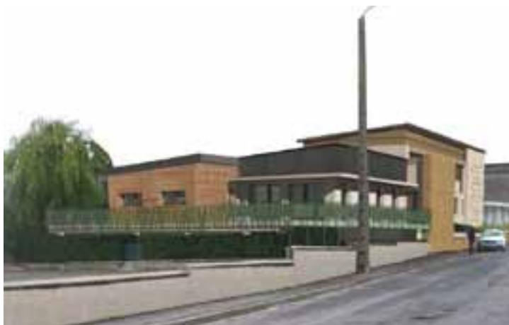
L'extension de la structure sera en ossature bois

Cette structure qui sera située au 4 rue de l'Agric-