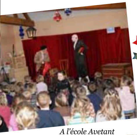
A l'école Avetant