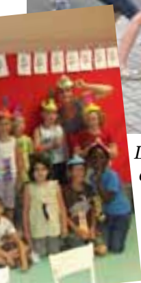
3 e semaine