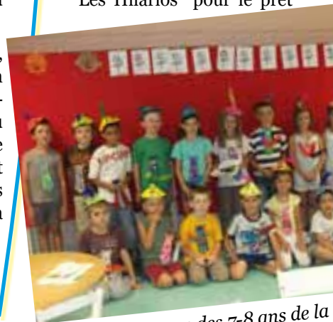
Le groupe des 7-8 ans de la

2010 était l'année du cirque. Les jeunes ont pu profiter de toutes sortes d'animations comme, entre autres, "création de son chapeau de clown" pour les petits, découverte des arts du cirque pour les plus grands, sortie à Charleville-Mézières pour découvrir le cirque Médrano au parc des expositions, pour tous. La dernière journée du centre a été l'occasion d'organiser un grand jeu de piste "Qui a kidnappé le clown ?" où tous les enfants accompagnés de leurs animateurs ont sillonné le parc Bellevue pour résoudre l'énigme. Pour les ateliers, les animateurs ont bénéficié de l'aide de l'association des "Marchands de Fable" et de la troupe des deux Masques "Les Hilarios" pour le prêt