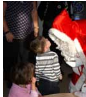
A l'école Dora Levi

C'est le 17 décembre que les enfants des écoles maternelles Avetant et Dora Levi ont retrouvé leurs amis «les Hilario's» venus pour leur conter des fables de La Fontaine revisitées. Des rires et des larmes d'émotions ont accompagné le talent de la troupe des Deux Masques.