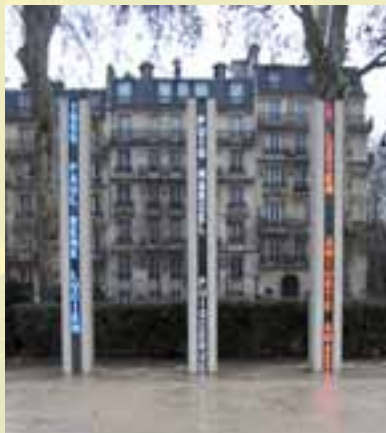
Le mémorial à Paris

travail sur cette période ô combien douloureuse. De nombreux débats restent encore à trancher avant de voir une mémoire dépassionnée et enfin apaisée, s'installer.