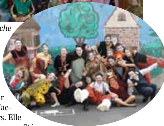
Les anim. !

Une nouveauté : le livret de suivi rapportant les activités des enfants âgés de 4 à 6 ans pour les parents car, c'est bien connu, les p'tits bouts d'chou oublient de raconter leur